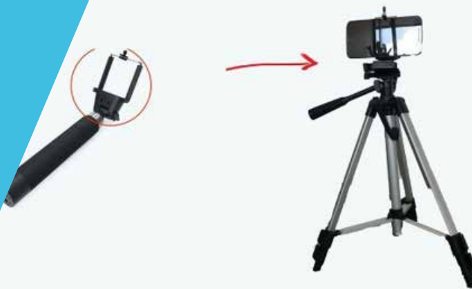
Ilustración 4. Con esta pieza de un bastón de selfies y un trípode se puede dar estabilidad a un celular