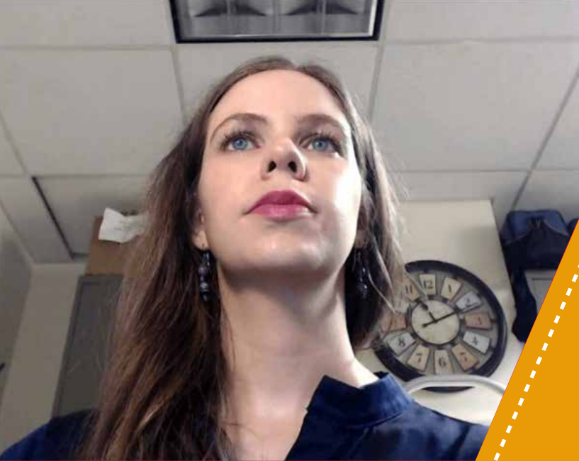
Ilustración 3. La cámara debe mostrar la escena de manera adecuada. Aquí por ejemplo la cámara está muy abajo y con un ángulo hacia arriba